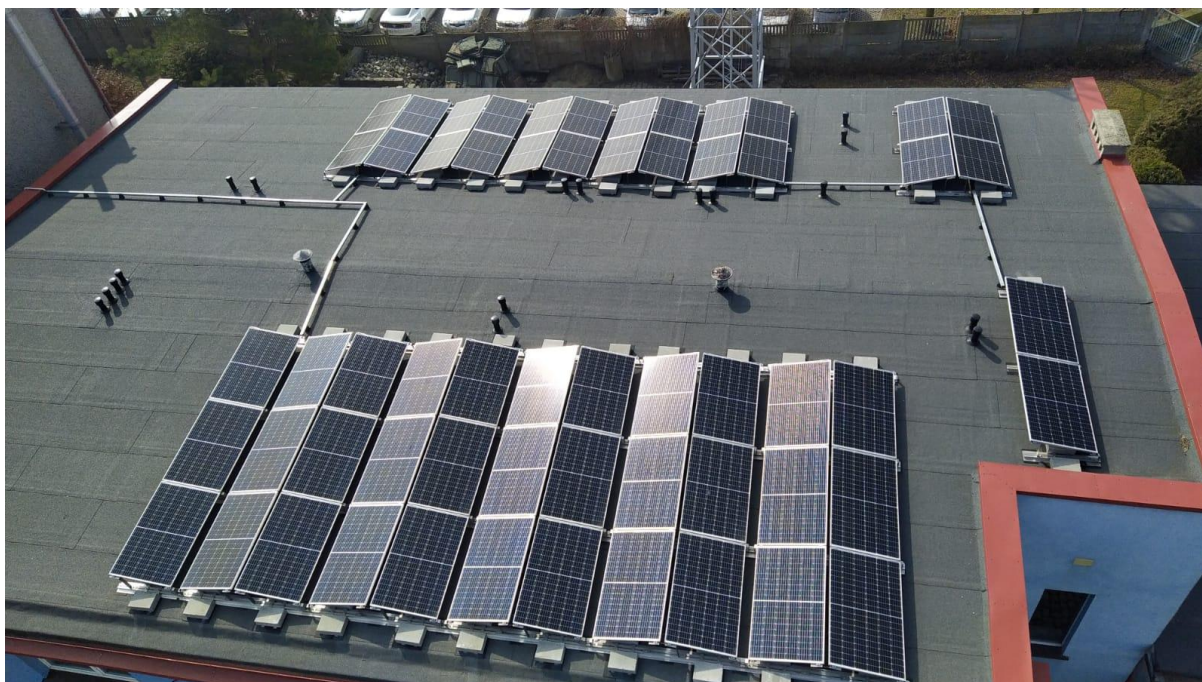
Instalacja fotowoltaiczna na dachu budynku garażowego.