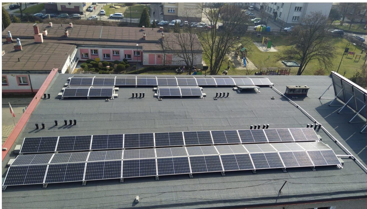
Instalacja fotowoltaiczna na dachu budynku koszarowego.

W roku 2019 został złożony wniosek za pośrednictwem KW PSP w Katowicach do WFOŚiGW o dofinansowanie przedsięwzięcia związanego z Instalacją Fotowoltaiczną na obiektach KP PSP Racibórz. Zadanie to udało się zrealizować w roku 2020 , zamontowano 2 instalacje na budynkach JRG po 20,35 kWp - całkowity koszt inwestycji 239 tys. zł, w tym pozyskano i zabezpieczono środki finansowe w wysokości 25 % wartości inwestycji tj, kwoty 59 750, 00 zł.