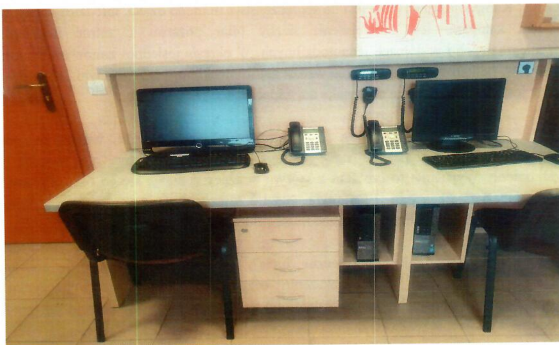
Zamiejscowe Miejsce Pracy w zlokalizowane w OSP Racibórz-Markowice

W budynku Ochotniczej Straży Pożarnej w Raciborzu – Markowicach utworzono Zamiejscowe Stanowisko Kierowania Komendanta Powiatowego PSP. Stanowisko posłuży jako zapasowe miejsce pracy w sytuacji, w której obecne SKKP nie będzie mogło funkcjonować, np. z powodu wystąpienia awarii sieci teleinformatycznej, zakażenia COVID-19 u dyspozytorów, powodzi itp.